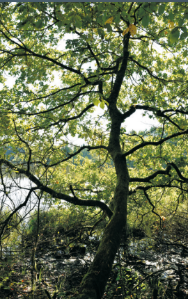
Balade en pleine nature entre les nombreux étangs aux abords de la commune d'Évette-Salbert