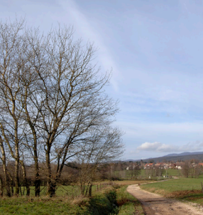
Ruisseau du Verboté