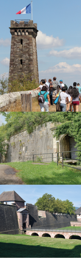
La Tour de la Miotte