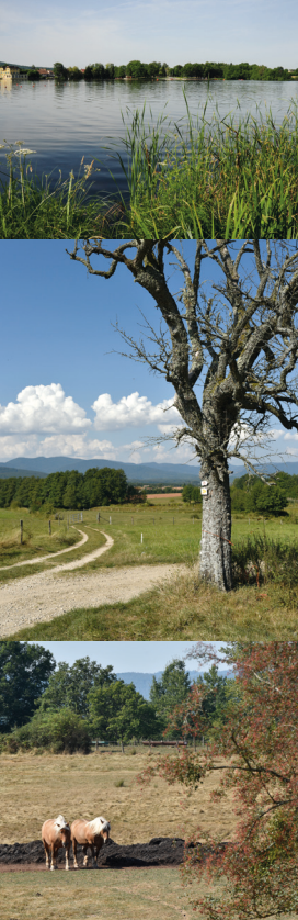
L'étang du Malsaucy