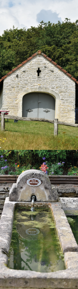
L'ancien presbytère du village de Bermont