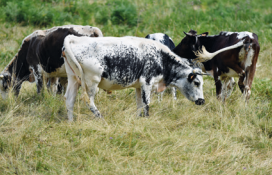
Paysage de campagne