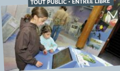
Scénographie: Basic Théâtral de Lyon

Théâtrale, poétique, interactive, cette exposition conçue en 2010 pour la Maison de l'environnement, a déjà interpellé plusieurs dizaines de milliers de visiteurs.