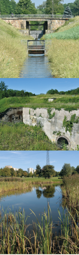
Le canal propice à de belles promenades